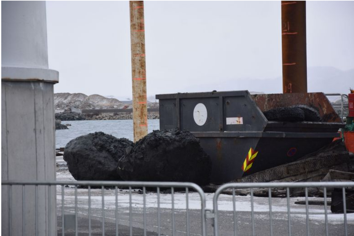
Masser fra det øverste laget i havnebassenget som er tatt opp som del av mudringen.

forurensede massene blir kapslet inn og hermetisert, sier byggelederen.