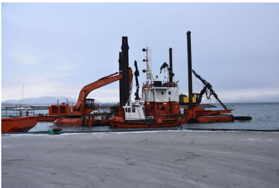
Mudreutstyr på plass i Brekstad havn.

Nå er jobben med å ta bort rundt 2 000 kubikkmeter forurensede masser og deponere disse i gang.