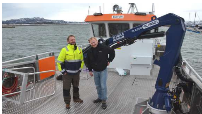
Båten er spesielt tilpasset arbeid med sjøkabler, men med stort dekk og kran samt baugport er «Triton» godt egnet til rene fraktoppdrag langs kysten.

Det er Promek verft på Smøla som har bygd fartøyet. Eirik Lundemo forklarer at den direkte bakgrunnen for investeringen til sju-åtte millioner kroner er at Norsk Havservice sikret seg kontrakten på vedlikehold av sjøkabler for TrønderEnergi. I tillegg er båten egnet for utlegg av nye og opptak av gamle sjøkabler.