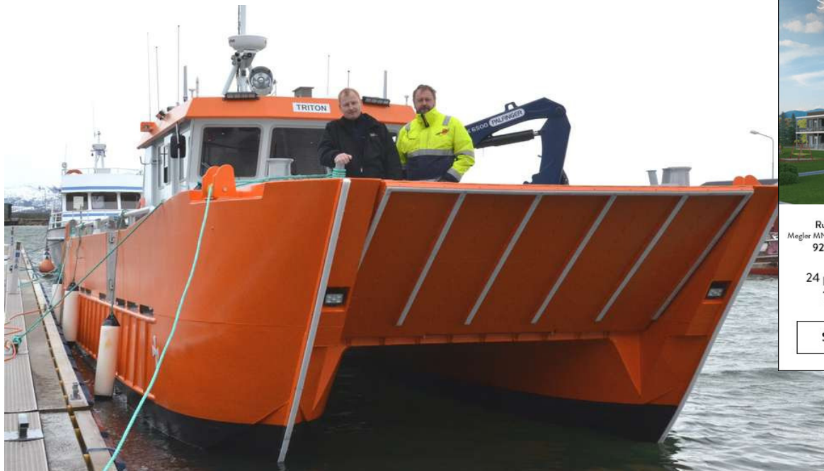
«Triton» ved kai i kystbyen Brekstad, der fartøyet også får sin landbase. Med bred baugport minner katamaranen mye om et landgangsfartøy.

FRONTPAGE / - «Triton» har alt som skal til