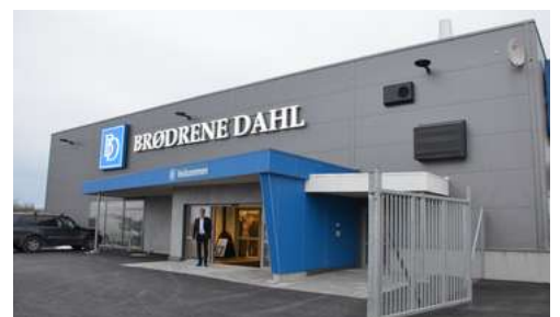
Brødrene Dahl har investert 17 millioner i nybygget på Brekstad Vestre.