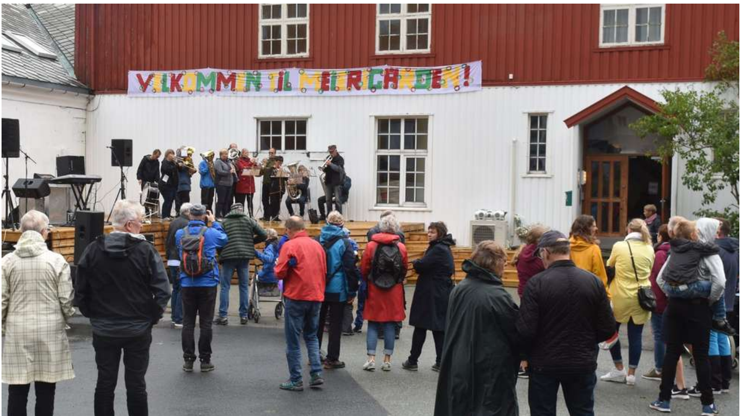
Åpning av Meierikroken under Ørlandsdagene.

Det var trangt om parkeringen i Brekstad under Ørlandsdagene og Ørland sparebank Cup, men mange søkte inn og vekk fra vinden, regnet og de få gradene gradestokken hadde å by på.