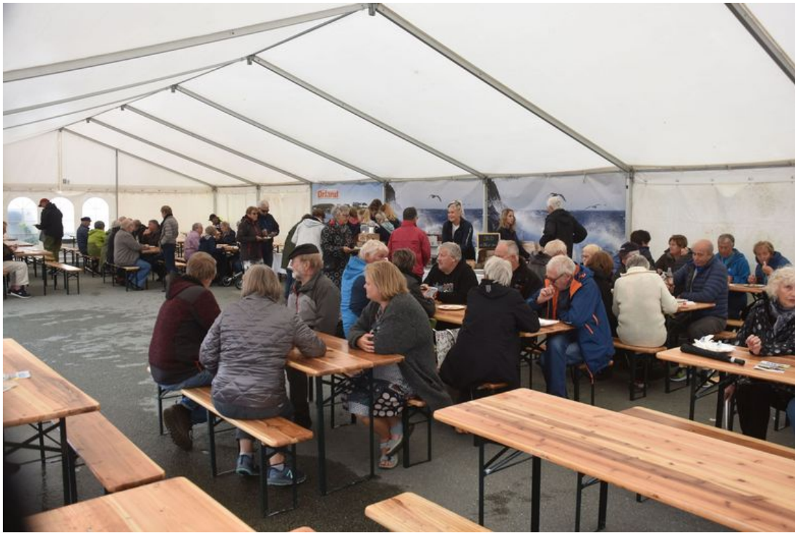
Sildebord i skikkelig telt.