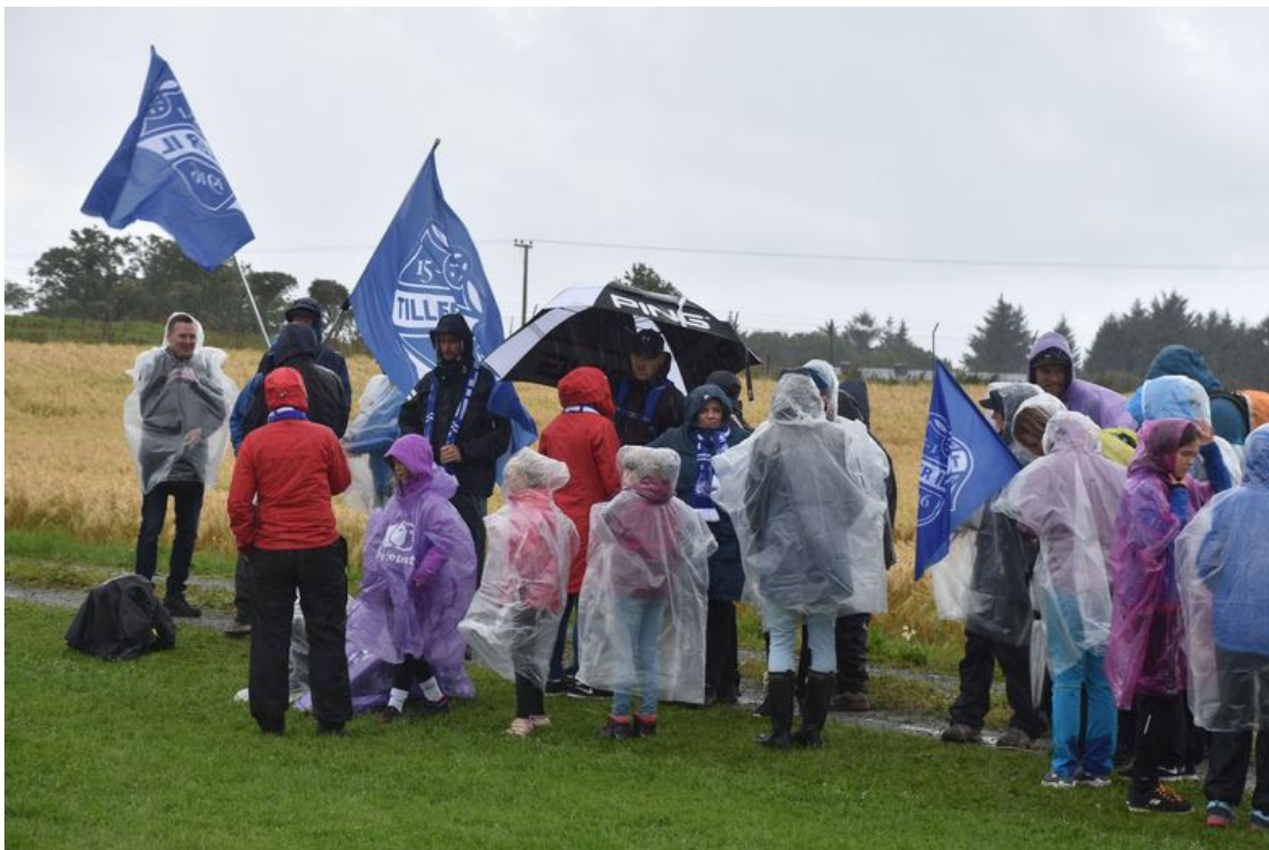
Rett antrekk for uteaktiviteter på Ørlandet denne helga.

Så ble scenen åpnet med musikk, sang og dans i regnet.