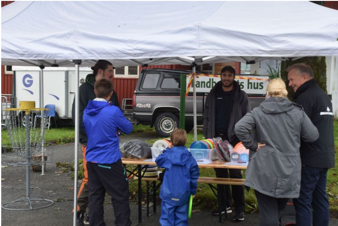
Boden med discgolf

- Så fikk vi nedbør for fjorten dager siden. Da var gulerøttene veldig små for eksempel, men har fylt seg skikkelig ut sier Hovde.