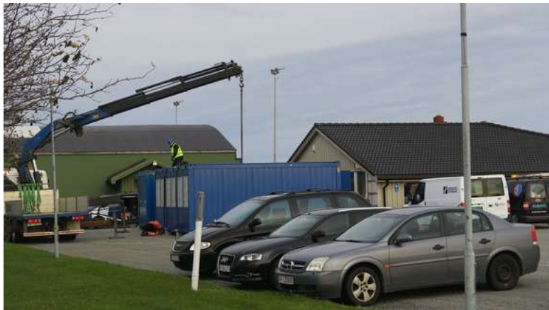
Byggingarbeidet pågår for fullt.

- Dere jobber raskt frem mot målet. Her venter ikke ting lenge, bemerket security-sjef Espen Trollvik i Fly Viking.