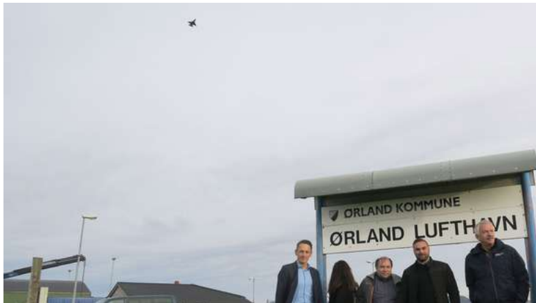
F-16 overflyving tar oppmerksomheten fra fotografen.

LES OGSÅ: Flere fosninger mener gratis parkering på Ørland kan få fosningene til å droppe Værnes.