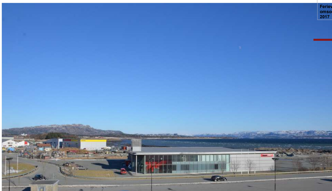
Klima- og miljøverndepartementet har gjort helomvending i spørsmålet om utfylling i Brekstadbukta.