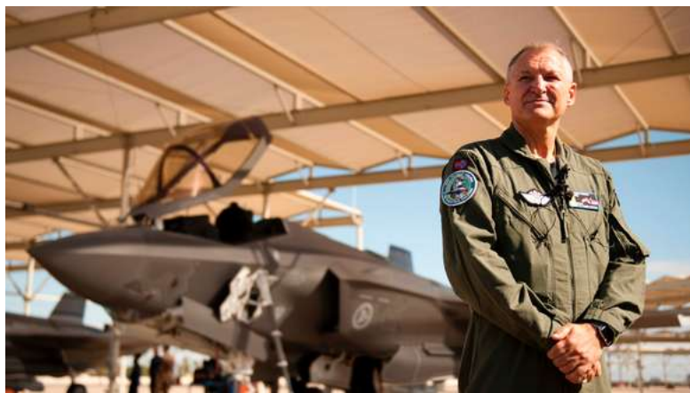
Generalmajor Morten Klever , programdirektør for det norske F-35 programmet.

LES OGSÅ: F-35 lander: Stor økning i antall ansatte på flystasjonen