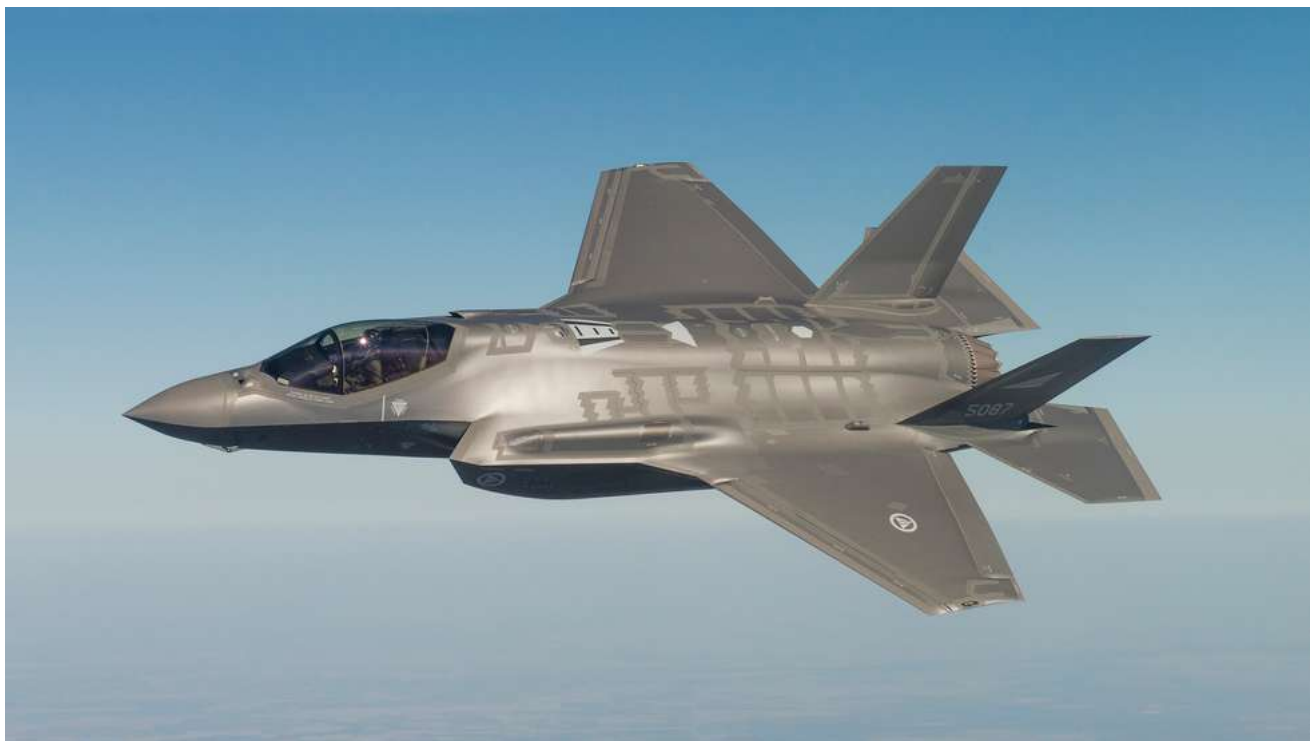
Testflyging av Norges første F-35 Lightning II i USA. I november kommer de første tre femtegenerasjons kampflyeme til Ørlandet. Det krever omlegging av Forsvaret.

FRONTPAGE / PLUSS / Dette er Norges nye kampfly, F-35 Lightning II