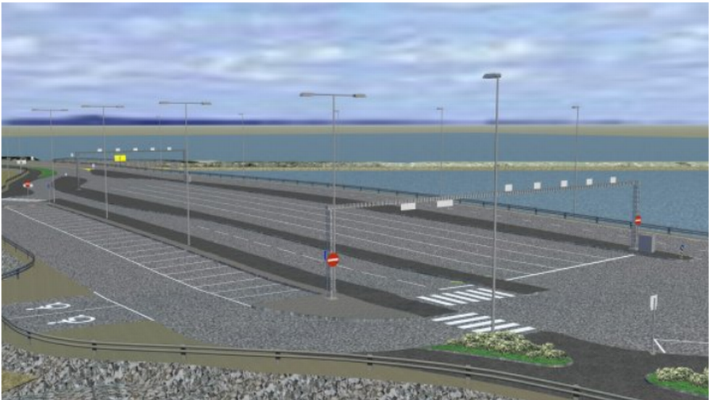
Slik blir den nye ferjekaia på Brekstad.

Statens vegvesen opplyser at det blir en kamp mot klokka å bli ferdig med den nye ferjekaia på Brekstad innen nyferjene skal settes i drift 1. januar 2019.