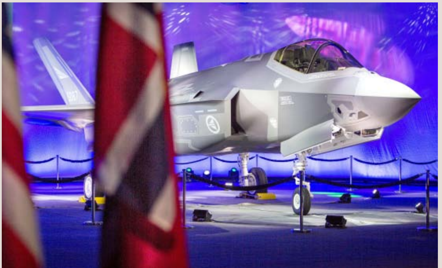
Sjø og luft får sine høyteknologiske kapasiteter i form av nye fly, fregatter og ubåter – våpen som virkelig har rask kampkraft på avstand og som derfor avskrekker.

Det er dette fantastene i fredslag og andre organisasjoner betegner som aggresjon. Men det er det motsatte, en nødvendighet for å stoppe noen fra å bruke militærmakt. Av denne grunn prioriteres