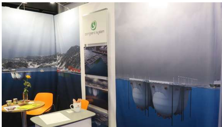
Botngaard Systems har skisser som viser en løsning med lukkede merder i sjøen på stand.

På messens siste dag sier Harsvik at Bjugn-bedriften har hatt godt utbytte av messen, og en del oppfølgingsarbeid etter gode møter med potensielt nye samarbeidspartnere.