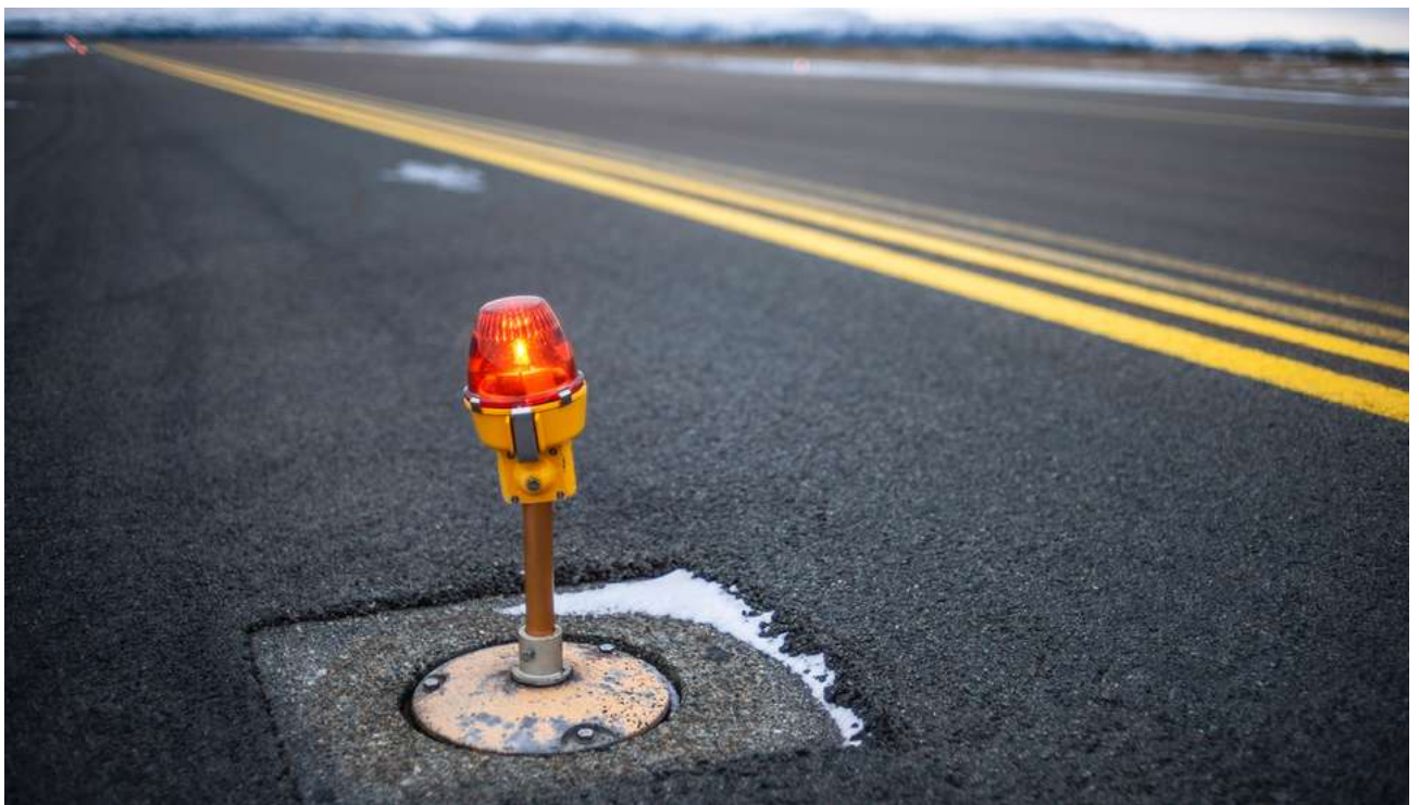
Rullebanen ved Ørland hovedflystasjon skal forlenges til 3000 meter

FRONTPAGE/FORSVARET/ NY KAMPFLYBASE-KONTRAKT INNGÅTT