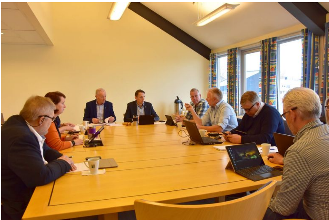
Et engasjert formannskap diskuterer mulig behov for å flytte den sivile lufthavna til helt uten for det militære området for så å busse passasjerer inn til rutefly på innsiden.