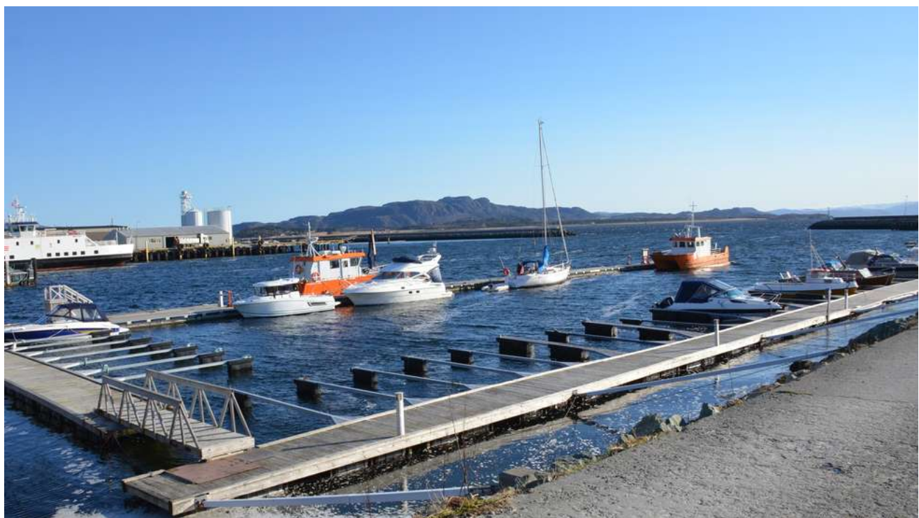
Kystverket ønsker å selge Brekstad havn. Både Ørland kommune og Sør-Trøndelag Fylkeskommune har fått tilbud om å kjøpe havna med moloanlegget for fire millioner kroner.