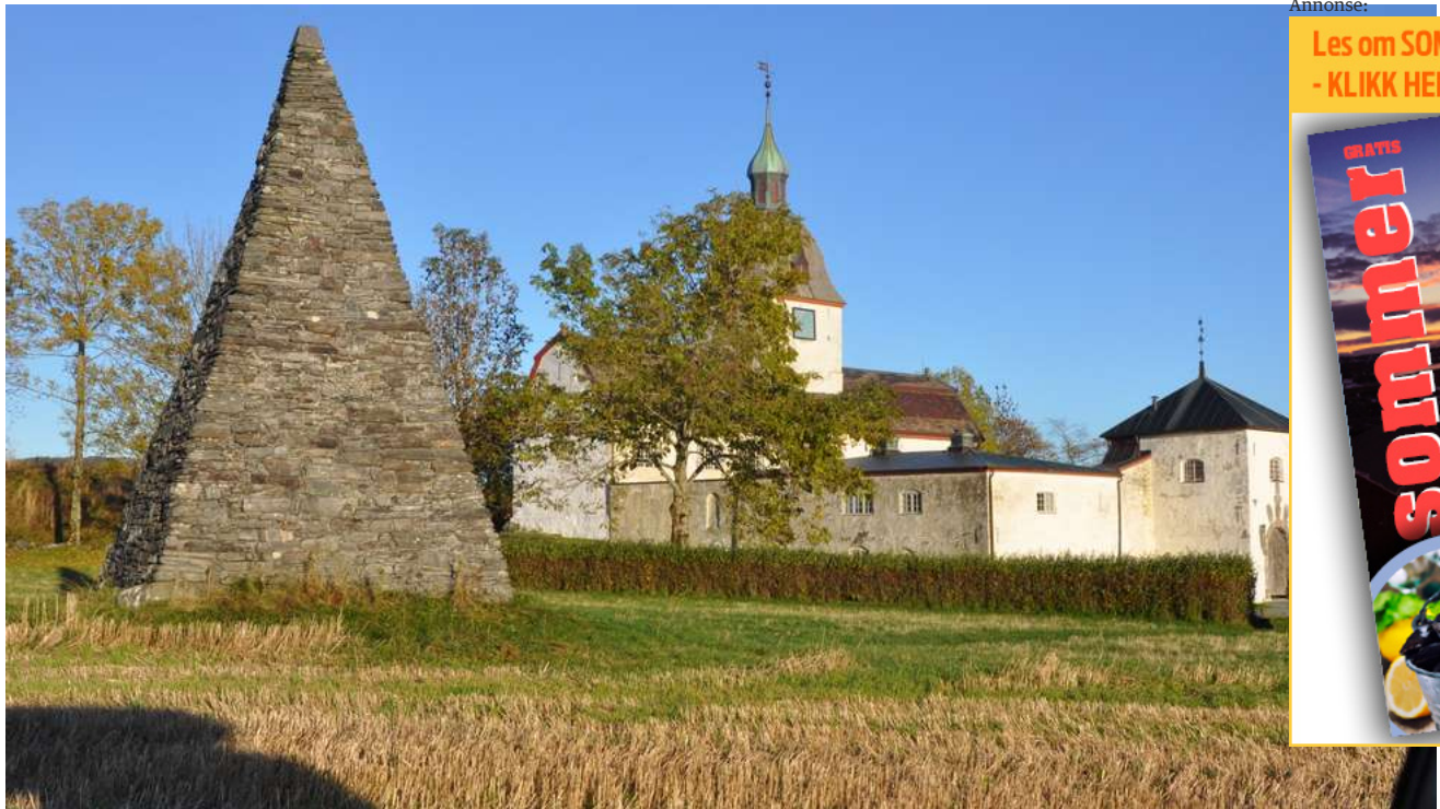
Åstrått-området fostrer fremdeles gründere innen landbruksnæringa som viser veg framover mot det grønne skiftet, mener rådgiver Ketil Kvam.

FRONTPAGE / - Norsk kupromp er ikke problemet