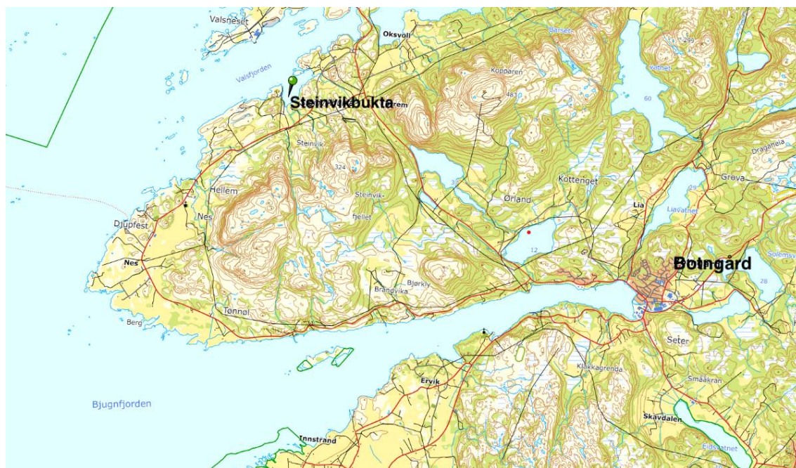
Kart 1: Viser planområdets beliggenhet i forhold til Bjugn sentrum i Ørland kommune.

Store deler av næringsområdet er i dag etablert gjennom utsprengning av berg/fjell og planert til ca. kote 2-3 moh. på det laveste. Terrenget i nord er mer kupert enn i sør, og består for det mest av berg/fell som reiser seg relativt bratt fra sjøen. To eneboliger grenser til planområdet i vest. Lenger mot vest finnes det flere hytter/fritidsboliger. I øst er det etablert kaianlegg og flere flytebrygger, som nå søkes oppgradert. I sør finnes to rorbuer, ett naust samt et næringsbygg som benyttes i forbindelse med fiske/fiskeforedling/salg. Adkomst til planområdet går via en privat vei, tilknyttet Steinvik veilag, med avkjøring fra fv. 6356.